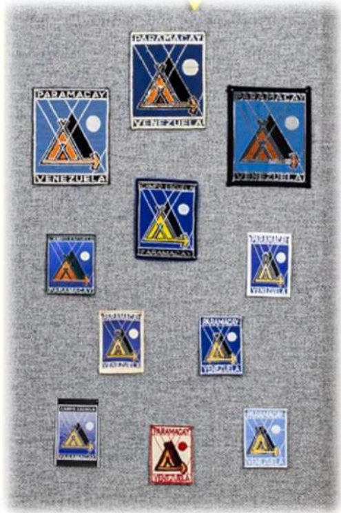
Variedades de la insignia, colección Museo Scout de Venezuela

Hernández 9 El diseño de planta se debe al arquitecto Leonel Requena, a partir de una estructura R3 ó R4 obsequiada por el Ministerio de Educación. 10 Con una superficie de 400 m2., la construcción tuvo un costo de Bs. 120.000, por donación del Ministerio de Obras Públicas (MOP). 11