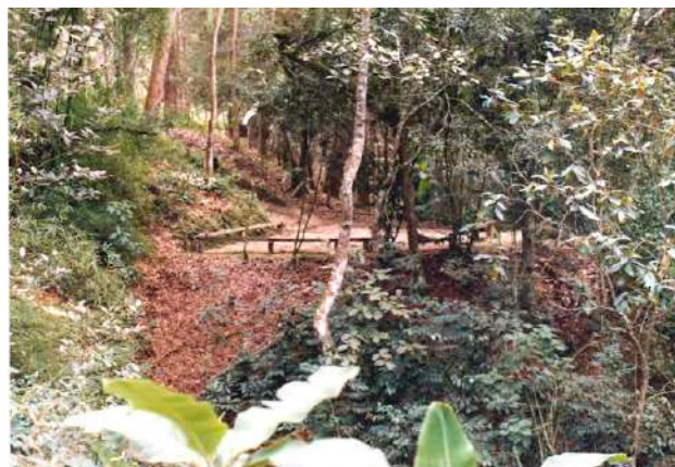
“El rincón del Pomarroso”, excelente lugar para sesiones de adiestramiento

En la inauguración del Campo Escuela tuvo especial importancia la presencia de Lady Baden-Powell, quien realizó el acto oficial de inauguración al clavar el hacha, también plantó un Araguaney al lado del molde de la huella del Fundador.