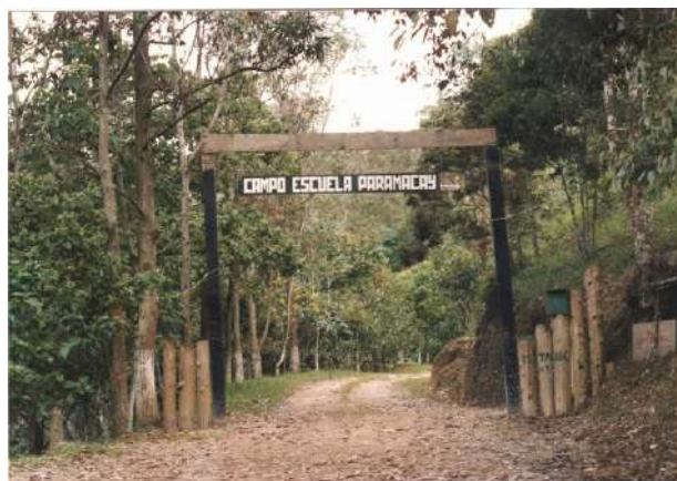
La entrada al Campo Escuela, cerca de 1990

El primer "Campo Escuela" fue la casa de la familia Machado en Los Chorros, Caracas. Esta era una casa de veraneo de la familia Machado y prestaron los jardines de esta para realizar cursos a dirigentes y guías de patrulla. Esta casa se usó durante el año 1935.