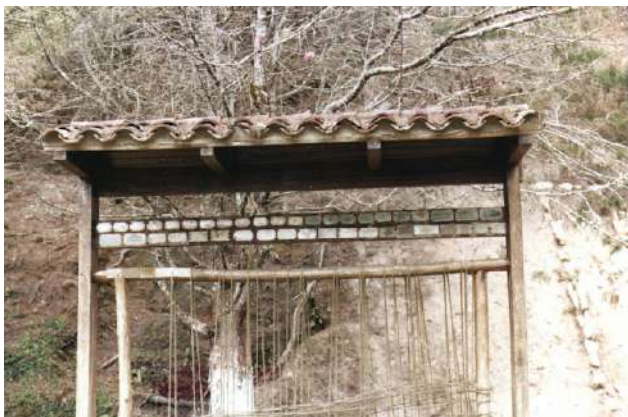
La cartelera en Campo de Banderas

Luego de perder “El Humo” la Asociación de Scouts de Venezuela buscó terrenos en varias partes del país, sin conseguir nada adecuado. Luego de algún tiempo se consiguió en comodato un terreno de la Electricidad de Caracas. El terreno quedaba más arriba del actual Campo Escuela Curupao (de la Asociación de Guías Scouts de Venezuela). Este terreno resulto muy inestable y tuvo varios deslizamientos de tierra que, a pesar del apoyo de la Electricidad de Caracas, decretaron la imposibilidad de usarlo. Este Campo Escuela también llevó el nombre de El Humo.