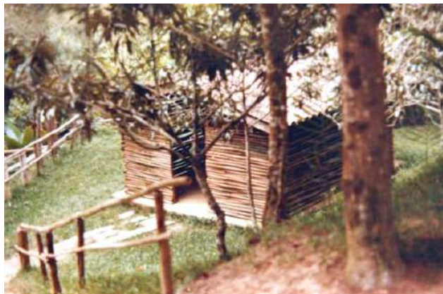
El Rancho de Secretaría

El Campo Escuela fue beneficiado con algunas donaciones, entre las que se recuerda la Casa Machado, donada por la familia Machado y edificación principal de Campo Escuela; también el asta de banderas, donada por la Marina de Guerra.