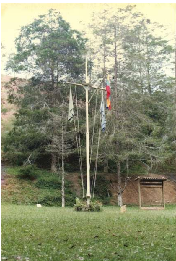
La asta de banderas con las banderas de Venezuela, de la Asociación de Scouts de Venezuela y del Campo Escuela

Las Asociaciones de Scouts tienen, en su mayoría, terrenos propios en donde realizan eventos diversos; principalmente (aunque no exclusivamente) para la formación de sus dirigentes. Estos lugares suelen llamarse, en castellano, Campos Escuela.