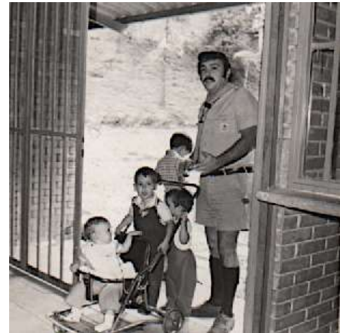
Fotografía año 1972

Fue con profunda emoción que nos trasladamos a visitar el campamento y me emocioné profundamente al ver acampar en Paramacay a mis propios nietos.