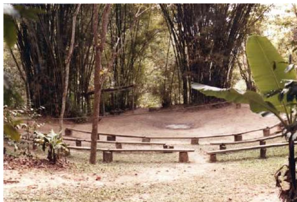
El Campo de Fogatas