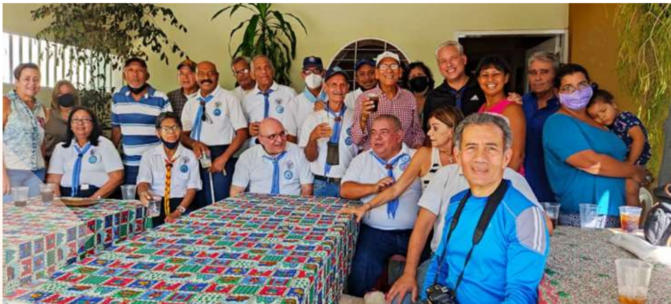
Finalizando 2021 con un muy concurrido, ameno y muy familiar almuerzo navideño.