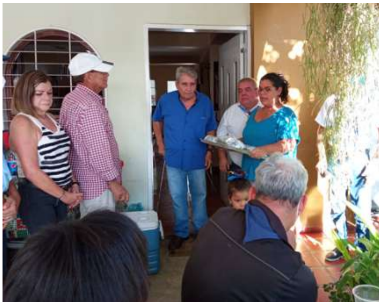
Dentro de nuestro programa de servicio a la comunidad realizamos un donativo consistente en almuerzo navideño para los Niños de la Comunidad Bendición de Dios