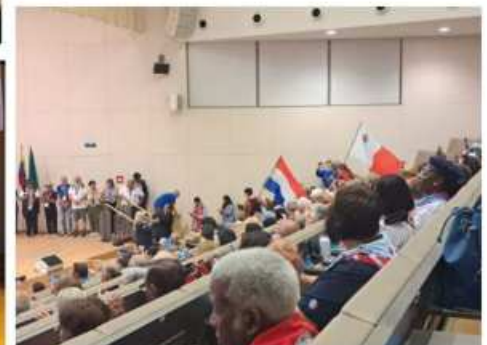
Fahneneinzug im Audimax