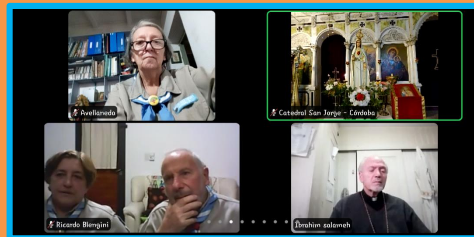
Ha colaborado con la Iglesia San Jorge, en la parte que corresponde a Córdoba, en la organización para determinar quien se hacía voz en el rezo del Rosario. También participaron fieles de la ciudad de Buenos Aires y de Rosario, todo en forma virtual