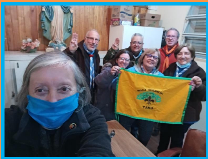
Y por fin pudieron realizar una reunión presencial luego de un año y medio de hacerlo de manera virtual.