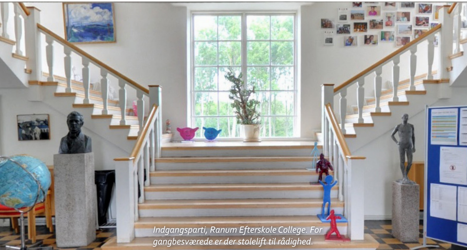
Indgangsparti, Ranum Efterskole College. For gangbesværede er der stolelift til rådighed.

Igennem tiderne har ISGF's Europakonferencer været afholdt på meget forskellige lokaliteter og under forskellige former.