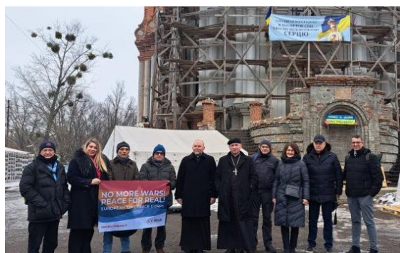
À la cathédrale catholique grecque de Saint-Nicolas