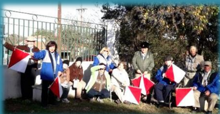
Campamento de Invierno

De a poco iremos mostrando algunas modalidades en la forma de trabajo y de encuentros. Como así también de actividades al aire libre y campamentos.