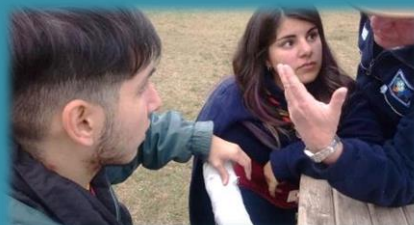
Técnicas de 1ros. Auxilios