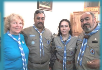
En una Asamblea Nacional