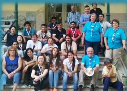
Servicio en un Neuropsiquiátrico