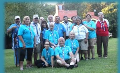
Campamento de verano