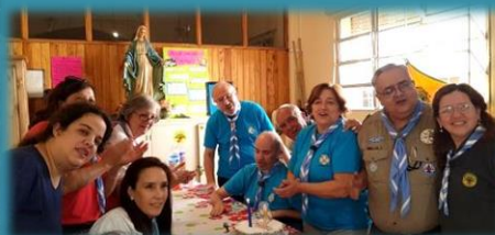
Festejo del 15 Aniversario de SGAA