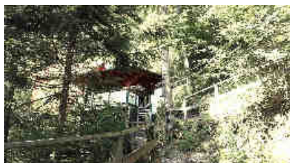
Hier die Nix-Höhle und der Muckenkogel