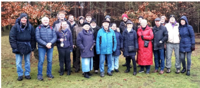
Eine fröhliche Runde beim Wandern Den Wienern gefällt es auch