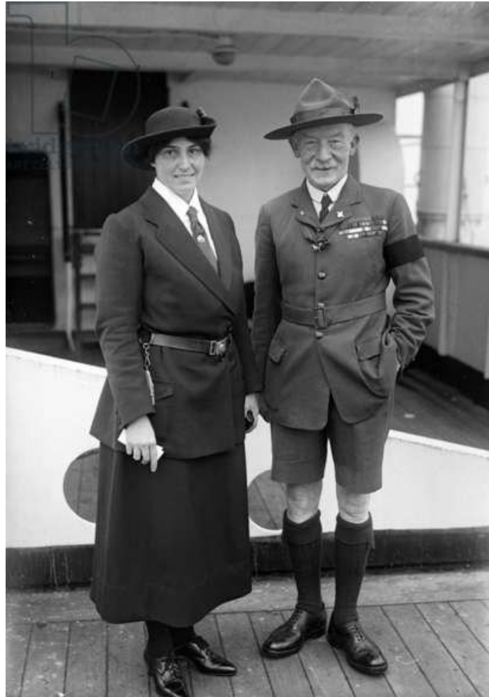
Lady Olave und Lord Robert Baden-Powell 22. Februar

Natürlich habt ihr das alle gewusst und daher mit c) die Frage richtig beantwortet. Ihr dürft euch daher — das ist der 1. Preis — selbst auf die Schulter klopfen. Und ob ihr nun in der Gilde gemeinsam oder zu Hause allein diesen Tag begeht, ihr könnt — natürlich auf eigene Kosten — mit einem Glas Sekt auf unsere Gründer anstoßen und ein dankbares „We are prepared“ sagen. Dankbar, dass wir Teil dieser großen und einzigartigen Gemeinschaft von Pfadfinderschwestern und Pfadfinderbrüdern sein dürfen. In diesem Sinne: