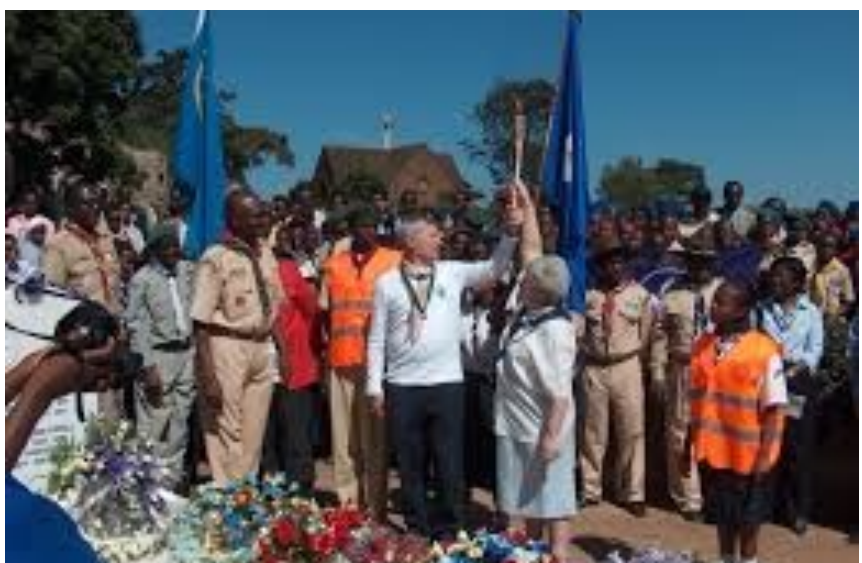
Spirit Flame am Grab von Olave und Robert Baden-Powell in Nyeri, Kenia