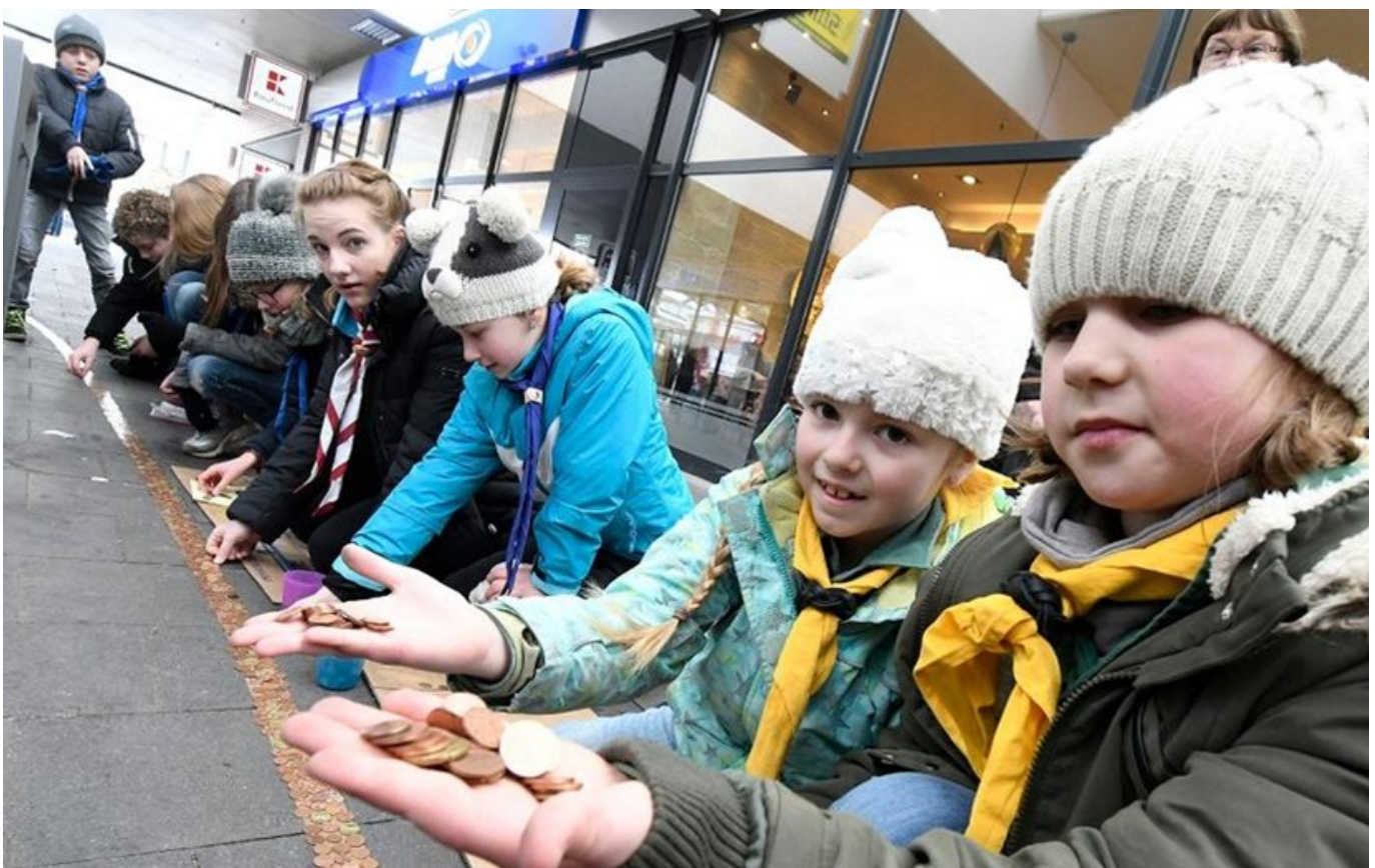
Thinking Day Aktion des Stammes Noah, Nettetal