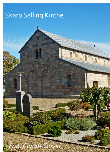
Skarp Salling Kirche

Erfahre mehr unter https://muslin-gebyen.dk/kultur/frederik-viis-kanal/