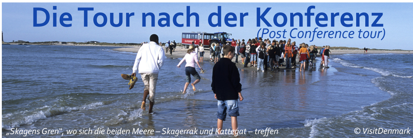
„Skagens Gren“, wo sich die beiden Meere – Skagerrak und Kattegat – treffen