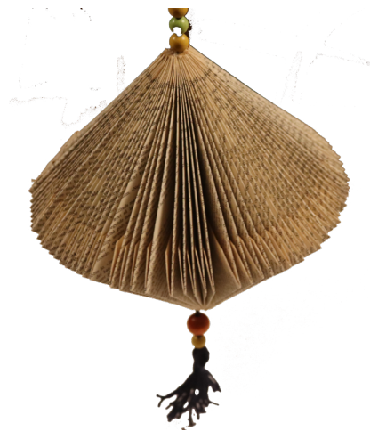
Før var jeg en bog

Der vil være mange forskellige aktiviteter inden for papir, garn og tekstiler, natur m.v.