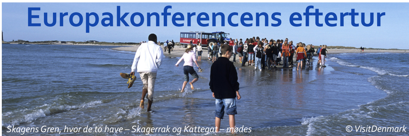
Skagens Gren, hvor de to have – Skagerrak og Kattegat – mødes