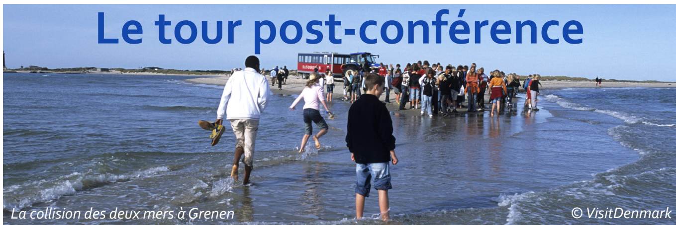
La collision des deux mers à Grenen