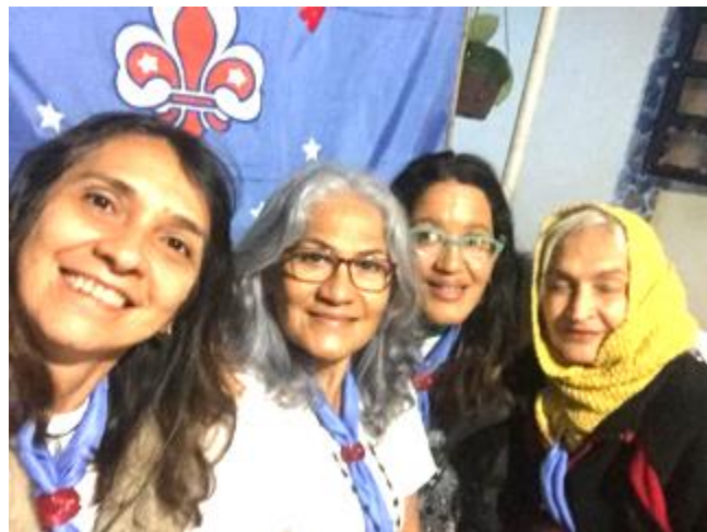
Caballo Recio (Sonia), Colibrí Inquieto (Omaira), Elefante Analítico (Minnena), Cóndor Mensajero (Nohely)

un lugar a tono con tu espiritualidad siempre será el lugar ideal para imaginarnos a nosotros mismos, solo debemos permitirnos, escuchar el llamado, integrarnos al lugar, (en nuestro caso a Natura).